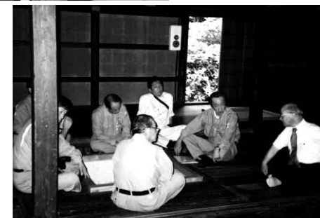
移転復元された宿坊「善道坊」にて立山信仰について説明を聞く