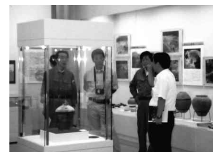
上市町 弓の里歴史館にて上市黒川遺跡群の出土品を見学、中世の霊場跡について学ぶ