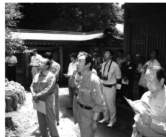
立山町 岩崎寺雄山神社 前立社壇本殿 (国指定重要文化財)

立山・黒部地域の世界文化遺産登録に向け、教育警務常任委員会は文化的歴史的な資産価値を再認識し、県議会として気運を盛り上げようと上市町、立山町を視察しました。中世、近世の山岳信仰や近代の発電、砂防事業を見学しました。