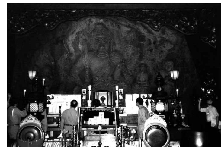
上市町 大岩山日石寺 不動明王の磨崖仏(国指定重要文化財)